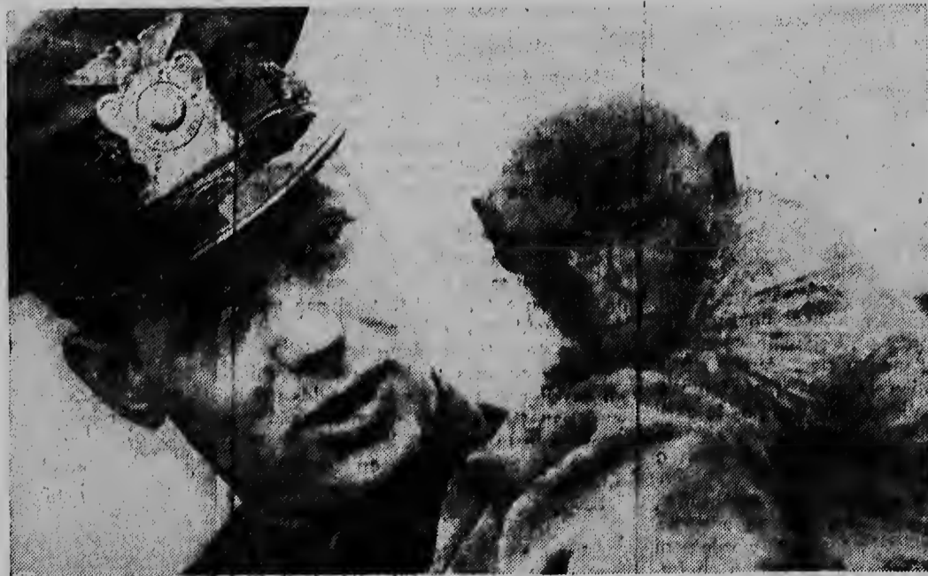
Parfin nan a captura Truant: E ultimo dje 36 macacunan cu a hui bai for di e dierentuin Villas Park na Madison, Wis. (Merca) E bandido chikitu aki a gosa durante casi tres luna largu di su libertad, y na diferente parti den e pueblo a causa hopi consternacion. Por ultimo spolis aki a bin garela den un garashi.

Polisnan a confisca un bandera Cubano y un Argentino.